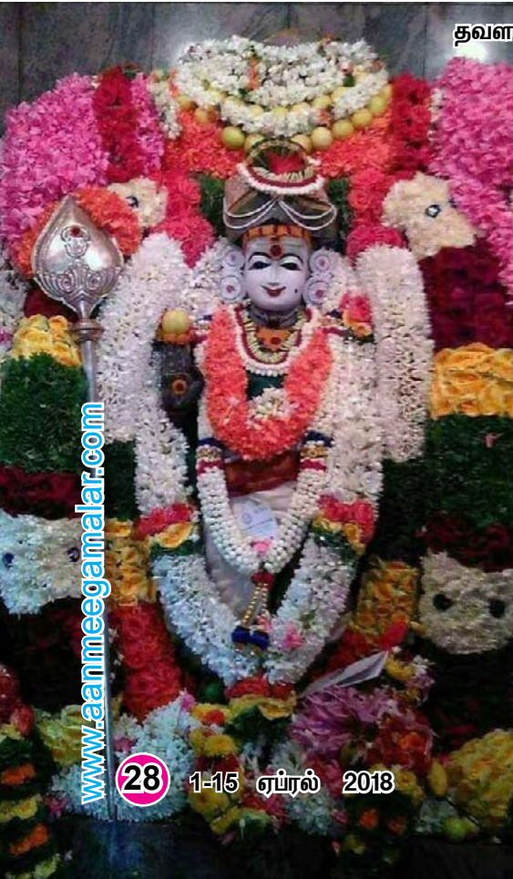
தவளகிரி தண்டாயுதபாணி சுவாமியின் பல்வேறு அலங்காரங்கள்

செழிப்படைய வைத்த முருகன்: முருகன் அருளால் இந்தப் பகுதி முழுவதும் விவசாயம் செழிப்புடன் விளங்கியது. இதனால் மக்களின் வாழ்க்கையும் மேன்மையடைந்தது. மக்களிடையே அமைதியும் மகிழ்ச்சியும் அதிகரித்த வண்ணம் நிம்மதியான வாழ்வு கிடைத்துவந்தது. இந்த செழிப்பிற்கு காரணமான முருகனுக்கு சிறப்பு செய்யும் விதமாக திப்புசுல்தான் தனது படைத்தளபதிகளில் ஒருவரின் வேண்டுகோளினை ஏற்று இந்த தண்டாயுதபாணி சுவாமிக்கு கர்ப்பகிரகம் கட்டித் தந்ததாக செவிவழிச் செய்தி உண்டு. வெண்ணிறப் பாறைகளைக் கொண்ட